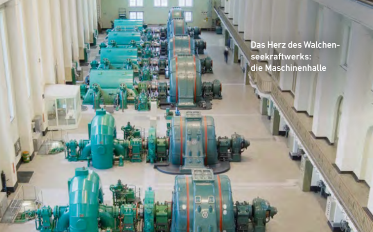
Das Herz des Walchenseekraftwerks: die Maschinenhalle